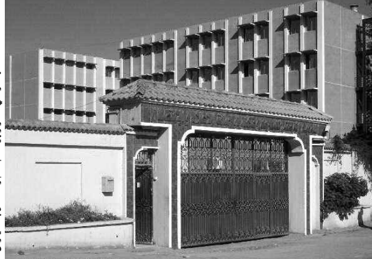
المعهد الوطني لتكنولوجيا الإعلام والاتصال بالكاليتوس