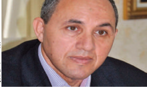
عز الدين ميهوبي وزير الثقافة

وفي مدينة بجاية سيتم تصنيف كهف أفلو بورمل الواقع ببلدية ملبو، دائرة سوق الاثنين، وهو كهف يمتد زمنه إلى آلاف السنين وكشف عن أقدم تماثيل الفن المنقول بإفريقيا في شكل تماثيل مصغرة مصنوعة من الطين المشوي أرخت ما بين 18000 و 11000 سنة قبل الحاضر، كما كشف عن أقدم مدافن الإنسان ما قبل التاريخ في المغرب، بالإضافة إلى مخلفات إنسانية لسبعين فردا من سلالة إنسان "مشتا أفلو". علاوة على تصنيف الممتلك الثقافي حصن قرواية المشيد بالموقع الذي دثنت فيه "يما قرواية" الولية الصالحة التي عاشت خلال القرن السادس عشر وكثرت حياتها للمقاومة ضد الاستعمار الاسباني واعتبرت بذلك رمزا للكفاح ضد الاحتلال الأجنبي بالجزائر. ويشترط في التصنيفات سالفه الذكر أن يتألم شغل واستخدام المعالم التاريخية واستغلالها مع متطلبات حفظ الممتلك الثقافي.