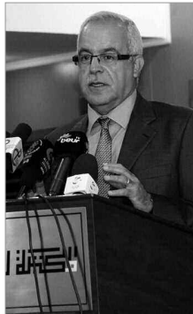
بسمطينة لتقييم أداء مختلف وسائل الإعلام خلال تغطيتهم لظاهرة قسطنطينية عاصمة الثقافة العربية التي اختتمت يوم 16 أبريل الجاري. وفي عرضها الذي خصصته لمجلس الصحافة كيبك تحت عنوان "40 سنة

جاء وزير الاتصال دعوته إلى الأسرة الإعلامية إلى أكثر احترافية ومهنية، مؤكداً خلال تصريح صحفي على هامش ندوة تكوينية لفائدة مهنيي الصحافة نشطتها رئيسة مجلس الصحافة "كيبك" أمس بالمكتبة الوطنية، أنه لو طبقت مقاييس الاحترافية ومعايير تشريعات العمل بصرامة فإننا لن نجد أكثر من 10 جرائد يمكن اعتبارها مؤسسات إعلامية مستوفية الشروط ولو نسبياً أيضاً وربما 20 جريدة على أقصى تقدير إذا غضضنا الطرف عن بعض النقص التي تتطلب جهداً أكبر من رؤسائها للتكيف مع منطق التسيير المؤسساتي.