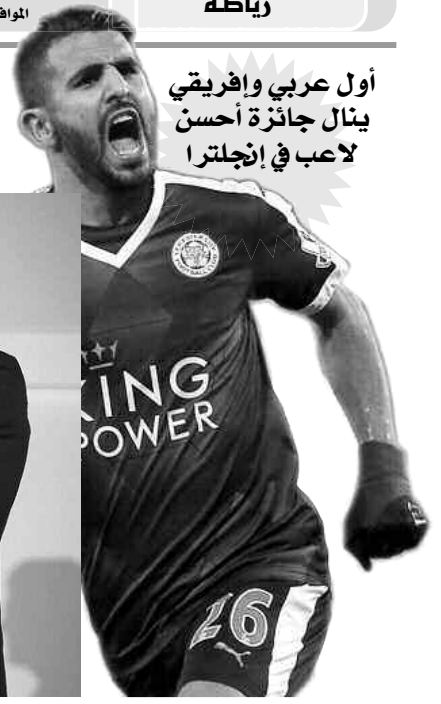
أول عربي وإفريقي ينال جائزة أحسن لاعب في إنجلترا