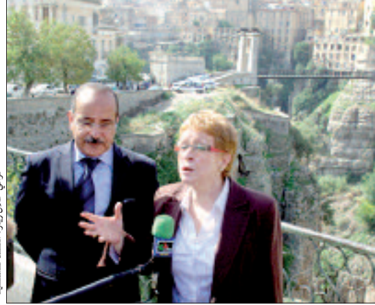
تومي خلال زيارتها لقسنطينة

وأفادت السيدة الوزيرة أن الصالون سيكون موعدا سنويا متميزا لمدينة العلوم والجسور المعلقة، ليشع بأنوار المعرفة على كل المنطقة.