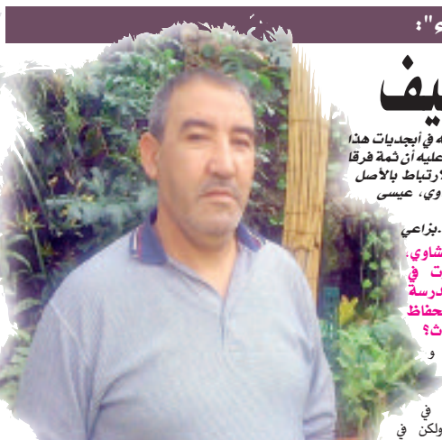
الأغنية الشاوية، أما بالنسبة

للمنتجين فرغم سليلانيهم إلا أن ذلك لا يمنعا من القول أنهم محققين في بعض الأحيان للدفاع عن مصالحهم. هل تضم صوتك للفنانين الذين يطالبون بتنظيم حفلهم المهنه؟ نعم أنا من مؤيدي فكرة تنظيم المهنة تمكن كل ذي حق حقه حتى لا يحظى من تسال من النافذة بنفس التكريم الذي يخص به من دخل الفن من الباب العريض وأغنى عمره في خدمة التراث والثقافة والتاريخ، كما أن تنظيم المهنة من خلال قانون يحمي الفنان من ظاهرة السرقه الفنية والأدبية يعد متفكسا وخطلوة إيجابية تصب في خدمة الفن.