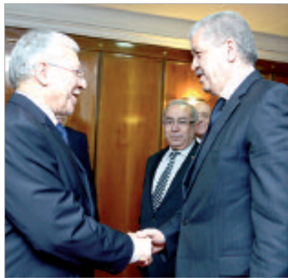
وأتف رئيس الدبلوماسية التونسية أن زيارته للجزائر ستستعرض العلاقات الاقتصادية والتجارية والسياسية بين البلدين إلى جانب القضايا الإقليمية والمغربية والعربية بصفة عامة،

وكان وزير الخارجية التونسي، الطيب بكوش، قد حل أمس، ببلادنا في زيارة تدوم يومين بدعوة من وزير الشؤون الخارجية السيد رمضان لعمامرة، وكان في استقبال الوزير التونسي للخارجية لدى وصوله إلى مطار هواري بومدين الدولي السيد لعمامرة، وأوضح بيان لوزارة الشؤون الخارجية، أن هذه الزيارة "تندرج في سياق ترسيخ وتعميق عرى الأخوة بين البلدين وتيسير مخرجات ما تمخض عنه لقاء السيد رئيس الجمهورية عبد العزيز بوتفليقة، مع نظيره التونسي الباجي قايد السبسي، بمناسبة زيارة الدولة التي قام بها إلى الجزائر يوم 4 و5 فيفري الماضي، من أجل وضع معالم استراتيجية لمستقبل العلاقات الجزائرية-التونسية في مختلف المجالات".