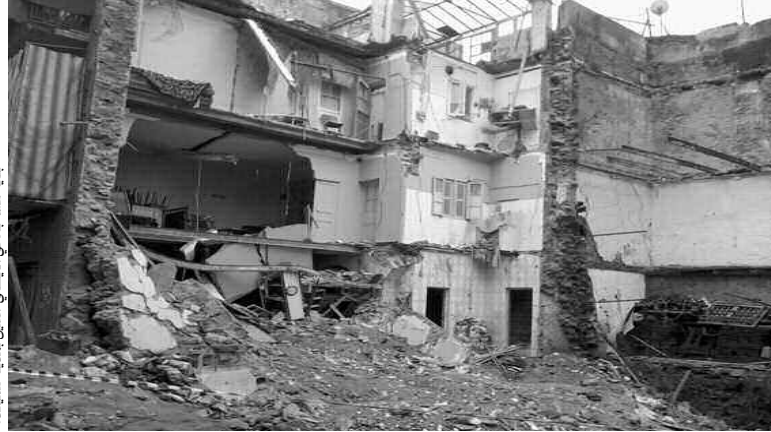
البناء على أنقاض البنايات الهشة بمدينة سكيكدة

فوق معمار قديم لأن البناء القديم يتطلب إنجاز دراسة شاملة، كونه متواجد بين هضبتين، كما هو الحال في شأن البناء القديم بسكيكدة، والهضبة تتحمل ثقلا محددا، بالتالي فإنه وفي حال تجاوز الثقل المرحض به، لا بد من إنجاز دعائم وجدران سائدة تكون مرفقة بدراسة تقنية دقيقة ينجزها خبراء متخصصون وحتى عملية البناء لا يمكن إسنادها إلى بنائين عاديين غير