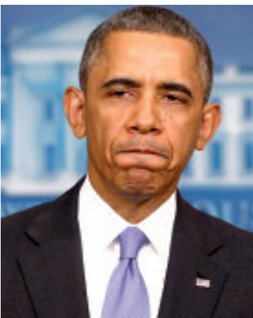
وليتانيا وليتانيا إلى الحد الذي جعل "سي.آي.إي."

وإذا كانت العفو الدولية تصر على متابعة المسؤولين الإسرائيليين قضائيا، فإن القضاء السويدي الرمي المنشقة أسس بعدما أعلن أنباء تحقيقاته في قضية اعتراض سفن، عامي 2010 و 2012، كسر الحصار عن غزة وعلى متنها متضامنون سويديون للعدالة أن تتحقق؟