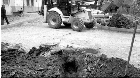
تهيئة الطريق 917