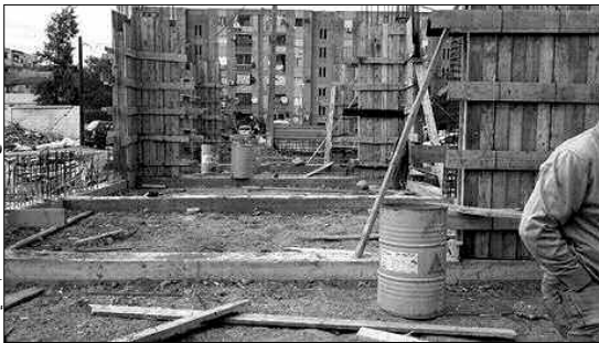
مشروع إنجاز توسعة 6 أقسام بحي 917