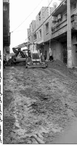
تطوير شبكة الصرف الصحي على مستوى حي الشهيد مندر