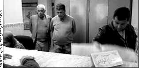
زيارة مفاجئة لفرع البلدي بحي الجمهورية

يمكن لتمكين السكان من الاستفادة من المياه الصالحة للشرب. كما وقف السيد ويشر على مدى تقدم وتيرة أشغال مشروع إنجاز توسعة 6 أقسام بحي 917 (الأمير)، ووجه إنذار للمؤسسة الكلفة بالإنجاز، وذلك من أجل الزيادة في وتيرة العمل والمقاييس المعمول بها في الأجل المحددة، وهذا بغرض فتح هذه المشاريع في أقرب الأوقات لحاجة التلاميذ إليها، لاسيما بعد ارتفاع نسبة الكثافة السكانية عقب عملية ترحيل سكان البيوت القصديرية إلى البلدية. وفي إطار حماية المحيط وتجميل المدينة، وعقب توزيع 11000 حاوية قمامة على مختلف الأحياء، تواصل بلدية الكاليتوس عملية توزيع الحاويات على مستوى حي كوريف محمد لترسيخ فكرة النظافة لدى السكان وتطبيق تعليمات والي العاصمة السيد عبد القادر زوخ الذي وضع محور النظافة من ضمن أولويات البرنامج المسطر بالولاية وتحويل العاصمة من الأوساخ إلى "عاصمة بيضاء". وفي إطار تقريب الإدارة من المواطن وتحسين الخدمة، قام رئيس المجلس الشعبي لبلدية الكاليتوس السيد، ويشر عبد الغني