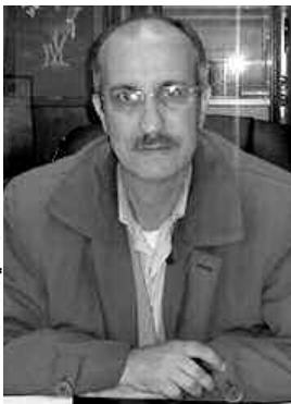
مدير المركز الجامعي بالبيضاء