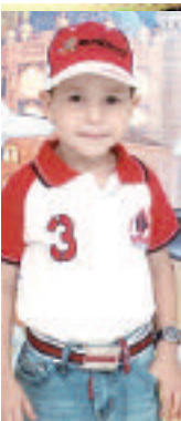
اليوم أطفأ الطفل المشاكس