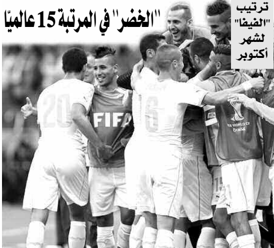
ترتيب "الفيضا" لشهر أكتوبر

للفيفا لشهر أكتوبر، كاتماد لسلسلة النتائج الإيجابية التي حققوها خلال التصفيات المؤهلة لكأس إفريقيا 2015. وبالنسبة لمنافسي "الخضر" في نفس المجموعة خلال تصفيات كأس إفريقيا 2015، جاء منتخب مالي في المرتبة الـ 58 متقدما بمرکز واحد، في حين خسرت ملاوي 11 مرکزا، لترتفع إلى المرتبة الـ 109. أما إثيوبيا فقد قفزت إلى المرتبة الـ 111. وعلى الصعيد العالمي، لم تتغير المراكز الثلاثة الأولى مقارنة بالشهر الماضي؛ بحيث حافظت ألمانيا على صدارة الترتيب، متبوعة بكل من الأجنيتين وكولومبيا. وقد أخذ بعين الاعتبار في تصنيف شهر أكتوبر، 141 مباراة، كانت 49 منها لتصفيات كأس أوروبا، و28 لتصفيات كأس أمم إفريقيا و10 في تصفيات الكونكاكاف، بالإضافة إلى 54 مباراة ودية.