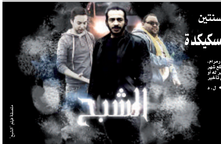
ملحة فيلم "الشبح"