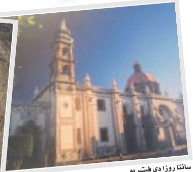
سانتا روزا دي فينتيرو

تُبنى في القارة الأمريكية، وقام بتشبيدها خوان بلافوكس أي مندوزا سنة 1646. وخصص، منذ نهاية القرن السادس ميلادي، واختار منتظمو المعرض صورة عن تقاليد سكان مدينة تلاكوتالان، وبإلضبط عن احتفالات عيد تطهير مريم العذراء، حيث يتم تنظيم احتفال كبير ونشاطات ثقافية وفنية ودينية متنوعة. أما صورة جوهرة بابالويان فهي بناء كبيرة بهندسة كلاسيكية، تضم أعمدة وأروقة عديدة في غاية الجمال.