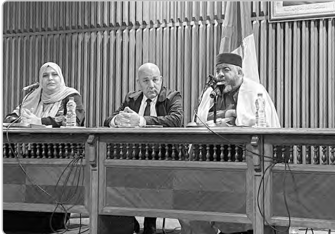
العروية رمز لازدهار الأمة قديما ... مجد لا يد من استعائته