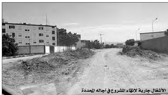
الأشغال جارية لانتهاء المشروع في آجاله المحددة

وقد استحسن سكان هذه المناطق التي يمر بها الطريق، هذا المشروع الحيوي، الذي سيكف عنهم العزلة، ويسمح بفتح خطوط نقل عديدة للمسافرين، خاصة الطلبة، وينعش الحركة التجارية، لا سيما بالقرى التي كانت معزولة.