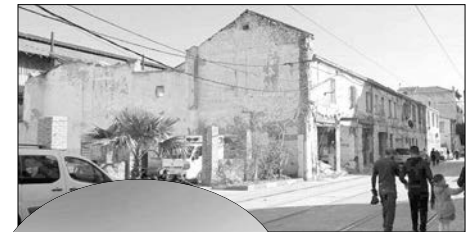
ذكر المصدر، أن البلدية ما زالت تنتظر دعم ولاية الجزائر، لاستغلال الأوعية العقارية المسترجعة من عمليات الهدم، وتقديم في المساعدة لحل الإشكال القانوني لمقرات العديد من الشركات العمومية والخاصة، التي يزيد عددها عن العشرة، موجودة على طرفي شارع طرابلس، علما أنها موهونة لدى البنوك، ولا يمكن نزع ملكيتها من أجل المنفعة العامة، إلا إذا سددت المؤسسات كل ديونها المترتبة عليها، مفيدا أن بعض هذه النفايات القديمة، لم تستغل ولاية ترميمها، كونها تشكل نشازا عمرانيا يشوه منظر المدينة، لاسيما بشوارع طرابلس الكبير، الذي يمر به خط ترامواي فيصفا تواصل مفاوضات الأشغال، ترميم الممرات القديمة بهذا الشارع الكبير، لإخفاء الوجه الشاحب، الذي شكلته النفايات القديمة وتلك الهشة الألية إلى السقوط.

أشرفت بلدية حسين داي، على فتح 5 مطاعم لإفطار الصائمين، وتوزيع وجبات ساخنة للعائلات المعوزة وعابري السبيل، حيث نصبت أكبر مطعم بمحطة الحافلات بالخروبة، التي تشهد يوميا توافدا كبيرا للمسافرين.