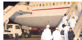
الموسم، بما يضمن نقل جميع حجاجنا الميامين إلى البقاع المقدسة.