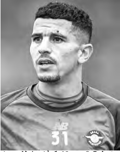
تقطيع 8.7 من 10، كاضف لاعب في المباراة.

جدير ذكره، أن اللاعب الدولي يوسف عطال، انضم إلى نادي أظنة سبور التركي في فترة الانتقالات الشتوية الماضية، بعد 6 مواسم متتالية مع فريق نيس، حيث شارك في خمس مباريات مع فريقه الجديد في الدوري التركي الممتاز.