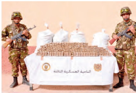
النجابة العسكرية الثالثة

الوقود و 9 أسنان من المواد الغذائية الموجهة للتغذية والمضاربة و 18 قنطارا من مادة التبغ، وهذا خلال عمليات متفرقة عبر التراب الوطني. من جهة أخرى أحبط حراس السواحل محاولات هجرة غير شرعية بالسواحل الوطنية 23 شخصا كانوا على متن قوارب مطبقية الصنع، فيما تم توقيف 621 مهاجر غير شرعي من جنسيات مختلفة عبر التراب الوطني.