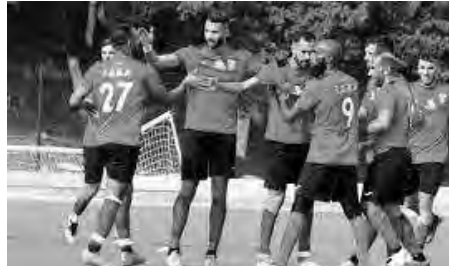
برنامج المباريات الجمعة 23 فيفري نجم بن عكنون - شبيبة الساورة (16:00 سا) اتحاد بسكرة - نجم مقرة (16:00 سا)

تلعب مساء الغد، مباريات الرجولة 181 من الرابطة المحترفة الأولى، التي ستجري على مدار يومين (الجمعة والسبت)، وتعرف تأجيل مباراتين، الأولى بين شباب بلوزداد ونادي بارادو، والثانية بين اتحاد العاصمة وفاق سطيف بسبب انشغال كل من الشباب والاتحاد بالمنافسة القارية.