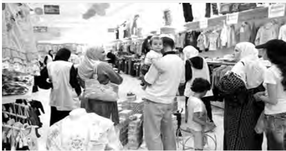
محلات حسيبة بن بوعلي مقصد الشباب