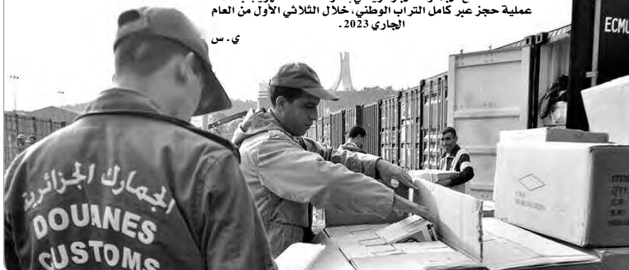
قامت مصالح الجمارك الجزائرية في إطار مكافحة التهريب بـ 367 عملية حجز عبر كامل التراب الوطني، خلال الثلاثي الأول من العام الجاري 2023.

حجز 3834 كغ من المعائن، 6282 كغ من الفواكه المختلفة، 836260 كغ من السميد والفريضة، 46050 لتر من زيت المائدة 612520 كغ من السكر، وفقا لنفس الحصيلة. كما تم حجز 27625 لتر من الفودو، و91349 وحدة من المرقعات والألبان التارية، و6857 وحدة من العتاد الحساس، و31674 وحدة من الألبسة والأحذية المتوقعة، 2377 كغ من الألبسة الرثة بالإضافة إلى مجوزات أخرى كالأدوية، مواد التجميل، محركات وقطع غيار مستعملة، أسلحة، ذخيرة، هواتف نقالة ولواحقها وغيرها من المحجوزات. واعترفت المديرية أن هذه الأرقام تعكس الجهود الحثيثة لأعوان الجمارك، سهر على حماية الاقتصاد الوطني، وذلك من خلال تعزيز برامج التدخلات الميدانية للتصدي لكل محاولات التهريب وكذا الجرائم العابرة للحدود، وكذا تنسيق برامج التدخلات الميدانية المشتركة مع مختلف الأسلاك الأمنية وعلى رأسها المؤسسة العسكرية.