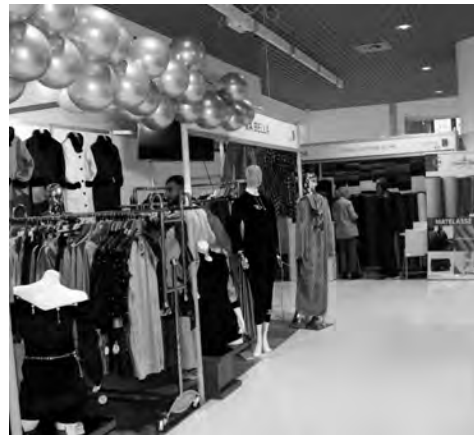
للتعرف، أكثر، على المنتج المحلي، داعيا إلى تقريب مثل هذه الفضاءات من وسائل النقل؛ تمكين العائلات الجزائرية من التنقل إليها بكل أريحية.