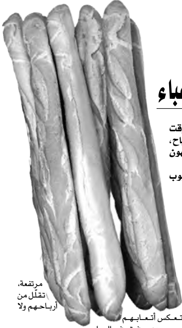
مرتفعة، تقلل من أرباحهم ولا

« ننتظر تطبيق قوانين الحكومة بشأن تحسين هامش الربح المطلوب تشديد الرقابة على المطاحن لضمان وفرة الفريضة « ثلثا المخازن أغلقت أبوابها بسبب محدودية الدعم وارتفاع حجم الأعباء