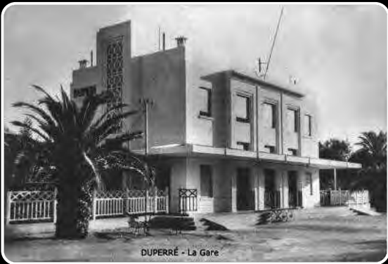
DUPERRÉ - La Gare