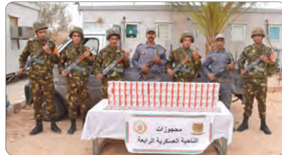
محجوزات التسليمية العسكرية الرابعة

كميات من المتفجرات ومعدات تفجير وتجهيزات أخرى تستعمل في عمليات التنقيب غير المشروع عن الذهب، في حين تم توقيف 14 شخصا آخر وضبط 632 كغ من 4.5 قنطارين من مادة التيج وكميات من المواد الغذائية الموجهة للتغريب والمضاربة تقدر بـ 16 طنا وهذا خلال عمليات متفرقة عبر التراب الوطني. كما أحبط حراس الحدود بالتنسيق مع مصالح الدرك الوطني، محاولات تهريب كميات كبيرة من الوقود تقدر بـ 98686 لتر بكل من برج باجي مختار وسوق أهراس والطارف وتسعة، فيما أحبط حراس السواحل، محاولات هجرة غير شرعية بسواحلنا الوطنية وأقتدوا 132 شخص كانوا على متن قوارب تقليدية الصنع، فيما تم توقيف 220 مهاجر غير شرعي من جنسيات مختلفة عبر التراب الوطني.