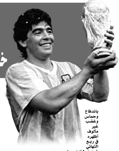
باندفاع وجماس وغضب غير مالوف أظهره في ربع نهائي ضد هولندا، حمل

سجل ميسي مئات الأهداف، وسحر عالم كرة القدم بمراته وتمريراته وإبتكاراته وسرعته.. هو قائد المنتخب الأرجنتيني، وأفضل هداف في تاريخه (96 هدفا)، والأكثر ارتداء للقميص (171 مباراة دولية)، غير أن ساحر الكرة صاحب الرقم 10 لم يفتز بكأس العالم؛ بحسب لاسن المجد بأطراف أصابعه قبل تبخر الحلم بخصارته نهائي مونديال البرازيل 2014 أمام ألمانيا (1-0) بعد التمدد. وقال الأرجنتيني ليوناردو باليردي، مدافع مرسييليا الفرنسي، "رؤية المنتخب الوطني يقفوز مع ميسي هو ما تامله جميعا كارجنتيني.. سيكون الأمر رائع.. في بلاد نعيش من أجل كرة القدم.. رؤية ميسي يرفع الكأس سيكون أجمل شيء في العالم". وقال خورخي سامباولي مدرب الأرجنتين السابق، "كرة القدم تدوين لميسي بكأس العالم". وبالنسبة لبعض المراقبين، فإن الفوز بكأس العالم ليس سوى مجرد تفصيل صغير؛ فميسي هو الأفضل إن فاز بكأس العالم