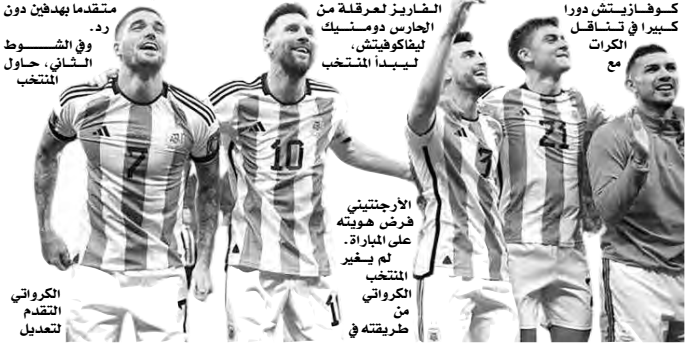
الكرواتي التقدم تعديل

حاول المنتخب الكرواتي غلق المباراة أمام الأرجنتين، واكتفى بـالسيطرة على الكرة بفضل تقارب وسط الملعب مع طريقه، ولعب ماتيو كوفازيتش دورا كبيرا في تساقط الكرات مع