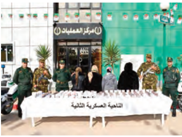
النتيجة العسكرية الثانية

بالوادي، في حين تم توقيف 10 عناصر دعم للجماعات الإرهابية في عمليات منفصلة عبر التراب الوطني.