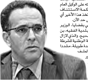
"القلم" الدولية تطالب المخزن بإطلاق سراح معتقلي الرأي

وفي هذا السياق، تعرضت الوقفة الاحتجاجية التي نظمها الجمعية المغربية لحقوق الإنسان مساء الاثنين الأخير، بمدينة القنيطرة إلى قمع مهجى غير مبرر، استعملت فيه القوة المفرطة لمنعهم من التظاهر السلمي. وأدانت الجمعية المغربية لحقوق الإنسان - فرع الناظور في بيان لها تحت عنوان "لا لتكميم الأفواه" قمع السلطات المحلية لوقفة الجمعية التي دعت إليها بمناسبة اليوم العالمي لحقوق الإنسان.