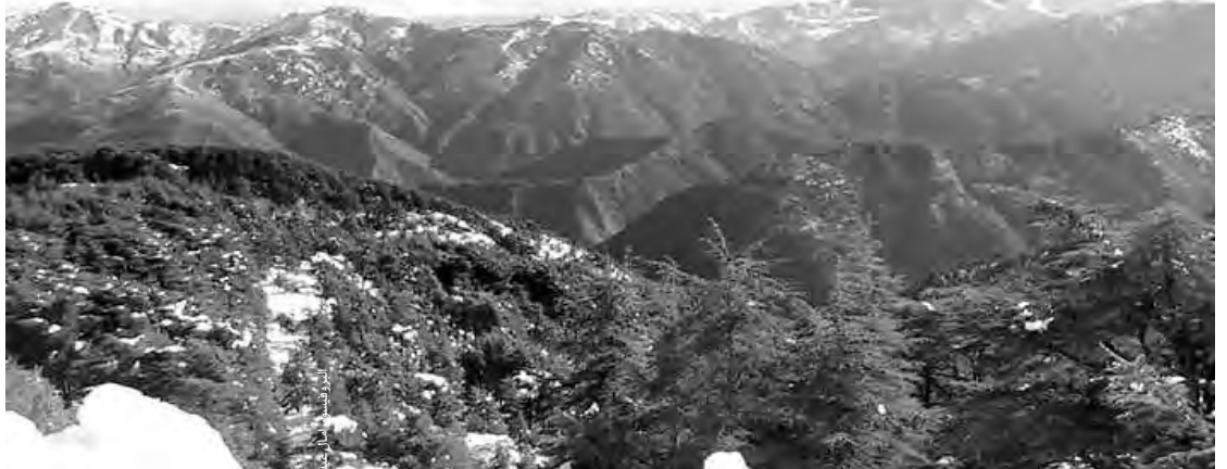
البلدية بولاية الشريعة

ولاية البلدية جارية أيضا من أجل إعادة بعث نادي التزلج، وإضافة مرافق جديدة لجذب الزوار والسياح، مشيرا في نفس السياق، إلى "الاطلاع على تجربة كوربا الجنوبية، الممثلة في وضع بساط اصطناعي للتزلج، إذ يسمح بممارسة هذه الرياضة على مدار السنة، ولما لا استقطاب الأندية التي تمارس هذه الرياضة على مستوى الحظيرة الوطنية للشريعة".