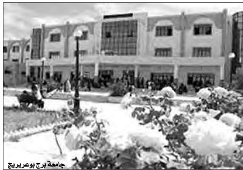
جامعة برج بوعريج

بالمقابل، سيتم خلال هذا الاستكتاب، الاقتراح بمواضيع المحاور الآتية: المكون الثقافي ومرتكزات الهوية الجزائرية من خلال منجزات الجمعية (التاريخ، الدين، اللغة...)، المقاومة الثقافية وحيدية (الأنا والآخر) في نتاجات الجمعية (الوعي بالذات، إعادة كتابة التاريخ، بناء الفرد، الوطنية، والبعد الإنساني)، جمعية العلماء وأسئلة النهضة (سؤال الحرية، سؤال التربية والتعليم، سؤال الأخلاق...)، والمقاومة الثقافية من المحلية إلى العالمية، علماء الجمعية وقضايا الأمة/ الإنسان (القضية السلطنتية، الحركات التحررية في إفريقيا والمعالم...).