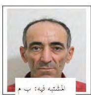
المشتبه فيه: ب. م