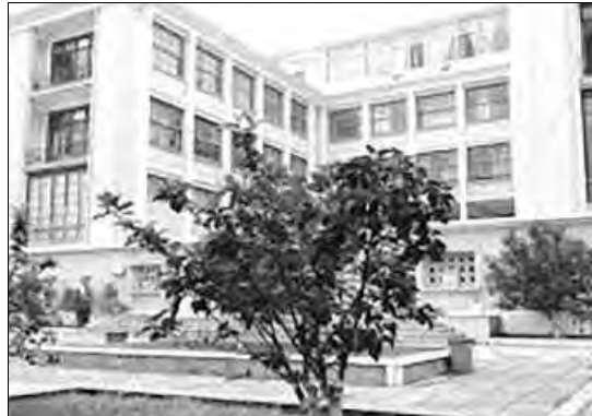
المدرسة العليا للفنون الجميلة بالجزائر وملحقاتها، يمتلك مبادرات فريدة وجماعية لخلق الفعل والنشاط الفني.

وشدد الفنان الهاشمي على أنه "إلى جانب المنجز الفني لرواد الفنون التشكيلية على غرار محمد إسباخ ومحمد خدة وغيرهما، برزت على فترات مختلفة، أسماء فنية تشكيلية جزائرية لها حضورها ومكانتها على المستوى العالمي، تسطع بإبداعاتها في أكبر قاعات العرض الفني ومتاحف في العالم، على غرار رشيد قريشي، وزينب سديرة، وحزمة بونوة". ودكر التشكيلي الهاشمي عامر بـ "جهود الدولة خلال هذه الفترة، وتوفيرها لكل الإمكانيات على مستوى مدارس الفنون الجميلة وملحقاتها التي تم استحداثها لاحتضان المواهب الفنية، لتحسين التكوين الفني، وترقية الفنون التشكيلية وباقي التخصصات بمناهج حديثة ومرافقتها، بهدف الحفاظ على تقاليد الممارسة الفنية الجزائرية الأصيلة التي تميز بين التراث والعصرنة"، داعيًا إلى "توفير مناصب شغل لخريجي مدارس الفنون الجميلة، وذلك لغرس الفنون، وترقية الفنون التشكيلية لدى الجيل الجديد من الطلبة في مختلف الأطوار التعليمية، وتشجيع المواهب واكتشافها". وأردف المصدر قائلا إنه يعتبر تجربته الذاتية "ثمره هذا الدعم في مجال التكوين الذي رعته الدولة منذ السنوات الأولى للاستقلال"، حيث استفاد، فغيره من المواهب الفنية، من منحة دراسية إلى الخارج (الصين، ثم فرنسا وغيرها)، شكلت فرصة لتلميع تجربتي الفنية بعناصر جديدة؛ خدمة للفن الجزائري، وللارتقاء به، وكذا للتعريف بالفن الجزائري.