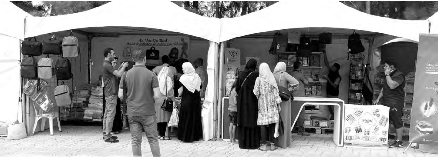
"سوق الرحمة" للأدوات المدرسية ببومرداس