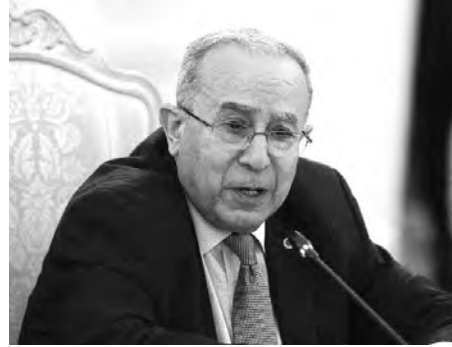
أفريقيا إلى جميع الهيئات الدولية. وأكد الوزير أن الجزائر ستستضيف بتولي هذه المسؤولية، مؤكدا أنها لن

وكانت لرئيس الدبلوماسية الجزائرية على هامش الأشغال، محادثات ثنائية مع نظرائه من دول الشمال، على غرار فنلندا، الدانمارك، والسويد، والنرويج، كما التقى عددا من نظرائه من الدول الإفريقية الذين شاركوا في هذه الدورة، خاصة وزراء خارجية جنوب إفريقيا، نيجيريا، رواندا، تنزانيا ونيجيريا.