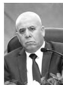
القانون 90-11 المؤرخ في 21 أفريل 1990، المتعلق بعلاقات العمل، "الانطلاق في الإنعاش الاقتصادي الحقيقي للبلاد"، وذلك من خلال إعطاء فرصة حقيقية لإنشاء المؤسسات، وأكد أن هذا التعديل

تمت دراسته ومراجعته مع أرباب العمل والنقابات، "حيث سيتم مراقبة أصحاب المشاريع الجديدة إلى غاية ضمان نجاحهم"، وبخصوص متابعة سير المشاريع المقترحة، أكد الوزير أنه تم تكليف المفتشية العامة للعمل بالمراقبة الدورية (كل 3 أشهر) للمشاريع، للنظر في حقيقة سير المشروع والتعرف على الاختلالات الممكن حدوثها على أرض الواقع. وذكر السيد شرفة ببعض المواد الواردة في المرسوم التنفيذي الذي تمت دراسته على مستوى الحكومة حيث "سيشرح هذا المرسوم فور صدوره شهر جويلية المقبل كل الجوانب المتعلقة بالبطالة الاستثنائية لصاحب المشروع وما يترتب عن ذلك من إجراءات".