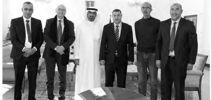
كانت زيارة ممثل الاتحاد العربي لكرة اليد، الأمين العام للاتحاد العربي لكرة اليد، جاهزية مدينتي وهران وأرزو لاستضافة البطولة العربية للأندية الجائزة على الكؤوس من 1 إلى 11 مارس 2022، عقب زيارة قادته إلى المواقع الرياضية والفندقية المخصصة لاستضافة الحدث العربي.