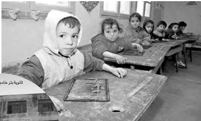
ثانوية بئر خادم

واللافت للانتباه أن مشكلة التدفئة في المدارس والمؤسسات التعليمية، تشمل، أيضاً، العشرات من المؤسسات التربوية التي بُنيت حديثاً في التجمعات السكانية الجديدة، والتي استفادت من التدفئة المركزية التي لم تجد نفعاً، على غرار حرمان تلاميذ مدرسة "الكروش" الجديدة بالموقع السكني "عدل" بالرغاية، من هذه الخدمة، إلى جانب العديد من المؤسسات بنفس البلدية، منها مدرسة بوعلام العلوي، وعطاه الله، وأحمد تيجاني، ومدرسة تالوارو، التي تواجه مشكل التدفئة المركزية التي لا تشغل نتيجة انقطاع الماء، على غرار مدرستي أحمد حمداً، وبونعامة التي تسبب خطأ تقني في التركيب الذي مس أنبوب الغاز، في حرمان التلاميذ من التدفئة، فضلاً عن مدارس تعاوست، وإبراهيم رحمون، وإسماعيل زيان، وابن باديس، التي تحتاج إلى تجديد وسائل التدفئة بها، خاصة تلك التي تم إصلاحها وتعطلت من جديد قبل استئناف الدراسة.