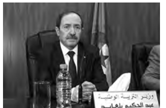
وزير التربية الوطنية عبد الحكيم بلعابد

ويرى مراقبون للشأن التربوي، أن إلغاء "السانكيام" قد يتم إدراجه في خاتمة الاختيار والاضطرار الناجمين عن تداعيات الأزمة الصحية، وما خلفته من اضطراب ساعات الدراسة، وكذا نتيجة دوافع تربوية وتعليمية قد لا ترى جدوى قاهرة من إجبارية هذا الامتحان.