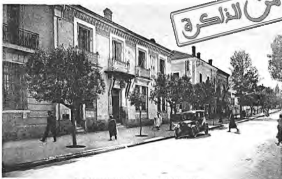
27. - ORLEANSVILLE - Postes et Télégraphes