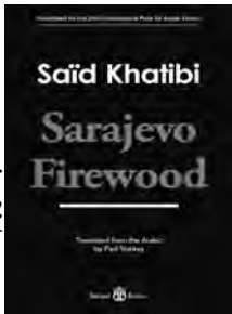
غلاف الكتاب المترجم

"حطب سراييفو" هي رواية للجزائري سعيد خطيبي. صدرت لأول مرة عام 2019 عن منشورات "الاختلاف" في الجزائر، ومنشورات "صنفا" في بيروت. ودخلت القائمة النهائية "القصيرة" للجائزة العالمية للرواية العربية لعام 2020، المعروفة باسم "جائزة بوكر العربية". وقد قام بترجمتها إلى اللغة الإنجليزية بول ستاركي. وصدرت عن دار النشر "بانيل".