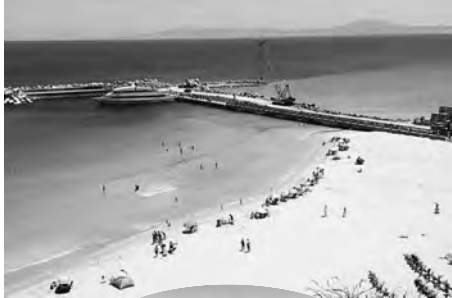
الظاهرة الطبيعية التي تسببت في تراجع المياه ونزوح الرمال في مرفأ السفن بشاطئ الكشبان بولاية وهران.

منها المياه، فيما اغتنم بعض أصحاب كراء المظلات الشمسية، والشمسيات الجديدة من الشاطئ، ووضع الطاولات والكراسي خلال الفترة الماضية قبل إغلاق الشواطئ. وكانت سلطات ولاية وهران ضمن مشروع فتح خط بحري لنقل المواطنين من ميناء وهران نحو شواطئ عين الترك وتشجيع السياحة الداخلية، قامت بمشروع لإنجاز مرفأ توقف اصطناعي إلى جانب كاسرات الأمواج، وهو المشروع الذي خصص له غلاف مالي هام تجاوز 18 مليار سنتيم، وشُمل على مراحل، غير أن الظاهرة الطبيعية أدت إلى إزالة المشروع في انتظار تدخل المصالح التقنية المختصة، للوقوف على المشكل والظاهرة، وإعادة الحياة إلى المرفأ وعودة السفن للتوقف بعد السماح لها بالعودة إلى النشاط.