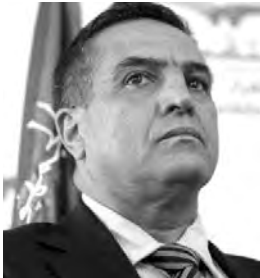
التشكيلات السياسية المشاركة.