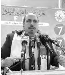
تستجيب لتطلعات كل منطقة .