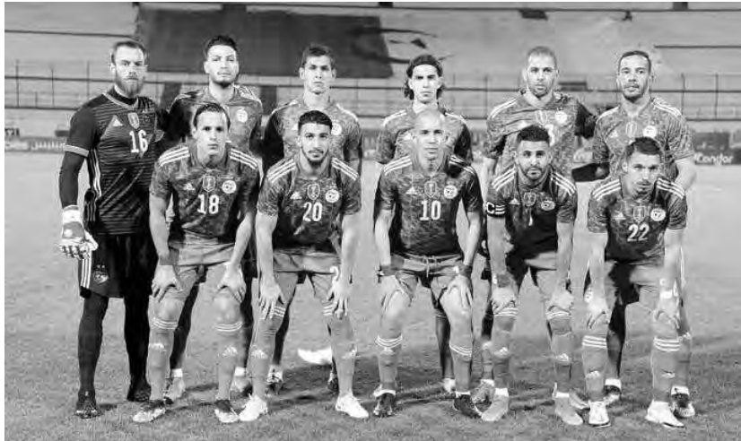
يتعرف المنتخب الوطني لكرة القدم على منافسيه في مسابقة كأس العرب 2021، وهذا خلال عملية سحب القرعة، التي ستجري بعد غد الثلاثاء، بالعاصمة القطرية الدوحة. و. توفيق

والإمارات العربية المتحدة واليمن. ومن المقرر الإعلان لاحقاً عن تفاصيل أكثر حول نظام البطولة وجدول المباريات. وتُعد بطولة كأس العرب بقطر 2021، فرصة مثالية لاختبار العمليات التشغيلية والمرافق، قبيل منافسات النسخة الأولى من مونديال كرة القدم في الشرق الأوسط والعالم العربي. وستقام المباراة النهائية لبطولة كأس العرب في 18 ديسمبر المقبل بالتزامن مع اليوم الوطني لدولة قطر، والذي سيشهد، بعدها بعام، نهائي بطولة كأس العالم بقطر 2022.