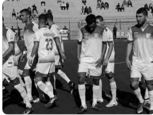
فحنن مجبرون على لعب كامل أوراقتنا وثاق بالانفس، ويضوي الحطوط في بلوغ

تسعى جمعية وهران، رائدة بطولة القسم الثاني (هواة) للمجموعة الغربية، للحفاظ على مركزها الريادي، عند استقبالاتها شبيبة تيارت، بعد زوال اليوم، في وقت يبقى المطارد المباشر مستقبل واد سلي، يترقب أي تعثر محتمل للجمعية للعودة إلى الصدارة، بمناسبة الجولة 13، والذي يستضيف داخل معقله مولودية سعيدة.