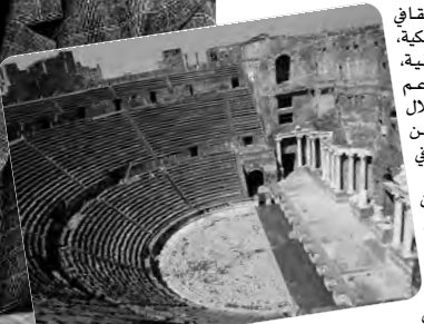
للكتاب في الجرائر، وتشجيع إنشاء مؤسسات عمومية

ويشارك أيضا في هذا المعرض العديد من المؤسسات الثقافية التابعة لوزارة الثقافة والفنون، التي تهدف إلى التعريف بمهامها ونشاطاتها، على غرار المكتبة الوطنية التي حضرت بتهارص مخلوطاتها، وقد عرضت خلال يوم الافتتاح "أربعة مخلوطات نادرة" أبرزها "المستعمل من كتاب التكملة" لمحمد أحمد بن عثمان بن قايماز النخعي، وهي مخلوطة "نادرة جدا ونفيسة وأصلية تعود إلى القرن 14هـ ميلادي"، تقول مسؤولة الجناح.