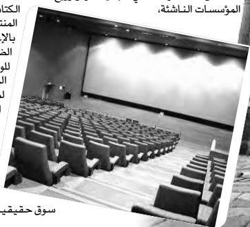
سوق حقيقية تنافسية