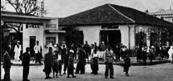
A - Rue Lamoricière