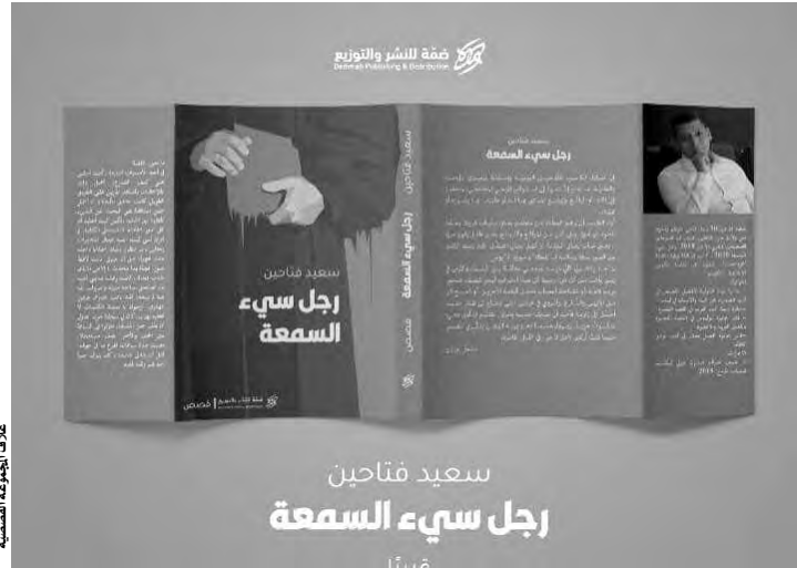
غلاف المجموعة القصصية