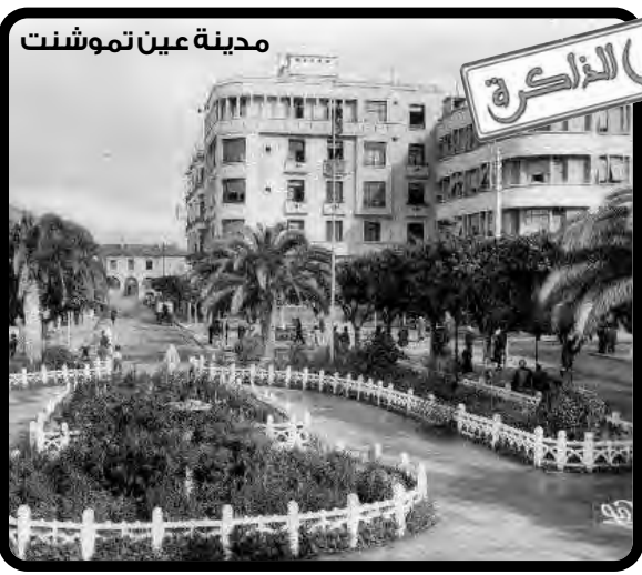
مدينة عين تموشنت

مزة أخرى، أظهرت الحرائق الأخيرة، بعدة ولايات، تضامن الجزائريين مع بعضهم بعض، وقت الجحش والشدائد، وهي الميزة التي تعيش وسطهم بالفطرة والفريضة. كما اهتزت مواقع التواصل الاجتماعي، بالتضلع إلى العلي القدير، أن يعمي الجزائر وشعبها، ويبعد عنها كل شر وشيزر، ويكشف النوايا الخبيثة، وينصر النوايا الحسنة ويعوض المتضررين ويرحم الضحايا ويسكنهم فسيح جناته ويلهم ذويهم جميل الصبر والسلوان.