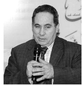
فهد بن بلة

التعبير. أما المستقبل فيتوقف على تنظيم مهنة الصحفي من حيث خلق سلطة الضبط، ونقابة قوية للدفاع عن حقوق الإعلاميين، مجلس أخلاقيات المهنة وغيرها من الأمور التي تؤطر مهنة المتابع، ومن ثمة ستكون حرية التعبير تحصيل حاصل، لأن الصحفي سيعرف من دون أي إملاء من أين ينطلق وأين يتوقف، المشوار طويل، صعب، لكنه ليس مستحيلا.