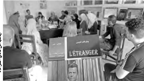
جانب من نادي القراءة