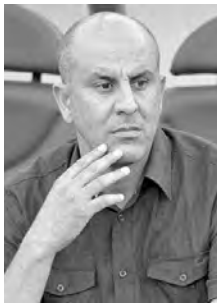
عن البلاد بسبب وباء كورونا. خالد ح.

يحسم أمره بالموافقة. واستقل بن صيد شداد اتصاله بين صغير، للحديث مع محضر بدي ومدرّب حراس مقيرين، حتى يتفاهض معهم على الالتحاق بالعارضة الفنية في حال سارت الأمر الإدارية كما هو مخطط لها، خلال الأيام القليلة المقبلة. وسعد الانتصار كثيراً بقرار نهاية أشغال الإنارة العمومية قبل بداية الموسم الكروي المقبل؛ إذ يمكن للفريق لعب مقابلته ليلا مثل باقي الأندية؛ ما يساعدهم على الحضور بأعداد قياسية، خاصة بعد رفع الحجر الصحي