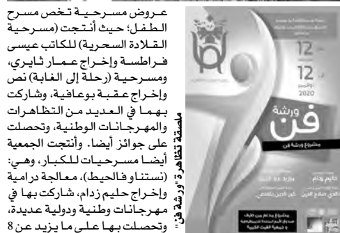
ملصقة تظاهرة ورشة فن