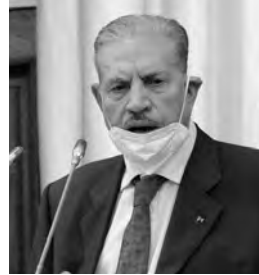
لهذه الأجيال .

من جهة أخرى، تلمق السيد قوجيل إلى ملف تعديل الدستور، مشيرا إلى أنه بعد النقاش والإثراء، ثم العرض على الاستفتاء الشعبي، ستكون هذه الوثيقة "دستورا للمستقبل يقيم مع الأجيال ولا يتغير ويكون في مصلحة الدولة الجزائرية التي سيبد كل مواطن نفسه فيها". في هذا الإطار، أبرز السيد قوجيل أهمية الذاكرة بالنسبة للأجيال القادمة، مذكرا في كلمته بأهم مراحل الثورة التحريرية بدءا ببيان أول نوفمبر، مروراً بمؤتمر الصومام 1956 ومؤتمر القاهرة 1957، مع التأكيد على وجوب "تدريس التاريخ وتلقيه