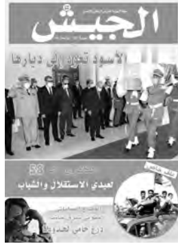
الجماعية للأجيال و دور أصدقاء الثورة الجزائرية في دعم الكفاح التحرري.

• الجيش يبقى مدافعا على أمانة الشهداء والسيادة الوطنية وحرمة أراضينا • الشباب مدعو لنفجير طاقاته لبناء الجزائر الجديدة