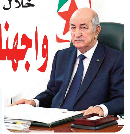
جراد يتراأس اجتماعاً لمجلس الحكومة

تأمين المعاشات والضمان الاجتماعي وإنعاش الاقتصاد