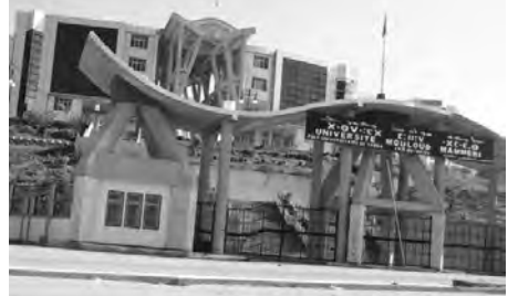
م. مخلوف لايعب

بمختصين نفسانيين. وبفضل جدول المواعيد يتم تنظيم الموقع؛ ما يسمح بالتكفل بكل الحالات، فيما وجهت الإدارة في هذا الشأن، نداء إلى كل الأسرة الجامعية المهتمة بهذا الموقع، والباحثين عن نافذة يتفنون من غيرها، بالتسجيل وأخذ موعد؛ ما يخفف عنهم، ويساعدهم في إيجاد الحلول التي كانوا يرونها في قبل غير ممكنة للتأقلم مع الوضع الجديد والحجر الصحي.