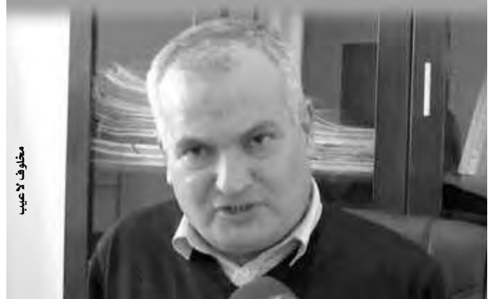
م. مخلوف لايعب

المتحدث بخصوص أزمة السميد المطروحة، أن الولاية تضم كميات كبيرة من الحبوب بتعاونية الحبوب والبقول الجافة لندراج بن خدة، داعيا المواطنين إلى التحلي بالعقلانية وعدم القلق والتدافع من أجل الحصول على كيس سميد، موضحا أن الأزمة ليست ناتجة عن نقص المنتج وإنما عن تهافت المواطنين وتخزين البعض له؛ خوفا من المستقبل المجهول بسبب جائحة كورونا، وأنه بعد أيام ستعود الأمور إلى وضعها العادي، مؤكدا أنه يتم توزيع نحو 1800 قنطار من السميد عبر تراب الولاية يوميا.