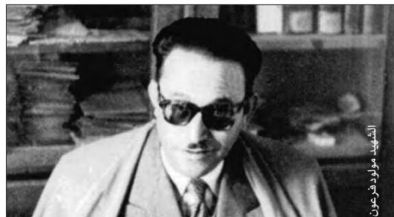
الشهيد مولود فرعون

كتب بعدها مولود فرعون عدد من الأعمال الناجمة من بينها "الأرض والدم" 1953، "أيام منطقة القبائل" في 1954، "الدروب الوعرة" في 1957، بالإضافة إلى ترجمة لـ "أشعار سي محمد" وثلاثة أعمال بعد وفاته "رسائل لأصدقائه" الذي نشر في 1969 و"عيد الميلاد" سنة 1972 و"حي الورد" في 2007. وقف مولود فرعون، في وجه الاستعمار الفرنسي لا يملك إلا اللغة الأدبية والتعبير عن الوجد الجزائري والمعاناة، ببساطة لأنها كتبت من أجل الخلود بأسلوب سلس عن البيئة المحلية للقبائل الكبرى وعن