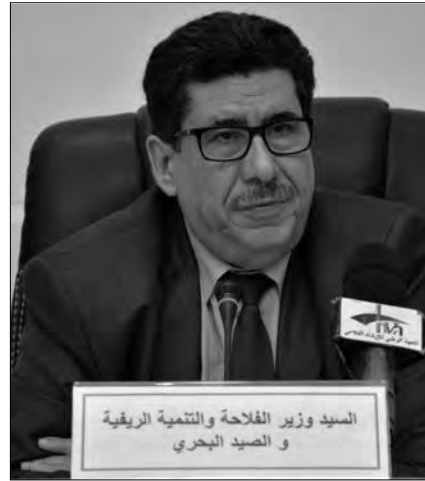
السيد وزير الفلاحة والتنمية الريفية و الشفيق البحري

ومداخل الخزينة العمومية من العملة الصعبة، خاصة وأن الإنتاج الوطني لم يزد عن 110 أطنان في السنة في الوقت التي تشير فيه المعطيات إلى إمكانية إنتاج 3 آلاف طن. مع العلم أن وحدات الإنتاج التابعة لخصوص تشتغل اليوم بـ 30 بالمائة فقط من طاقتها بسبب صعوبة استخراج شهادات المطابقة لتصدير المنتج للخارج، وهو الإشكال الذي تم حله مؤخرا، حيث يمكن لأي معهد بحث تابع للقطاع الفلاحي الاتصال بوحدة البحث لاستخراج شهادات المطابقة.