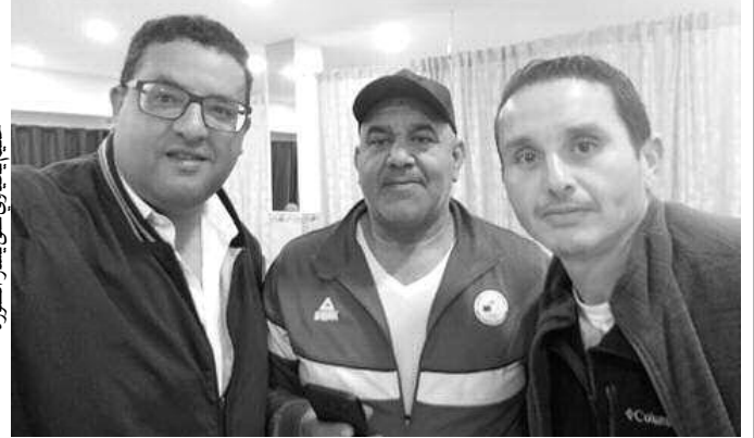
حكيم يحياوي على عجل بشار الصورة

هذه الاختصاصات تألق فيها حكيم يحياوي على المستوى الدولي مع المنتخب الوطني، الذي بقي عضوا في صفوفه سنتين، مكنته من كسب تجربة دولية غنية بالنجاحات؛ حيث كانت له مشاركات دولية عديدة كألعاب الأولمبية والبطولة الإفريقية والبطولة العربية، فضلا عن سيطرته في البطولة الوطنية لدى كل الفئات خلال التسعينات. يحياوي تألق كبطل وطني لمدة عشر سنوات في اختصاص رمي المطرقة، ومتحصل على ألقاب دولية، منها بطل العالم مرتين، ومركز ثان في الألعاب الأولمبية باليونان اختصاص رمي القرص، ونفس الرتبة في بطولة العالم ببولندا، لكن أجمل ما بقي يحياوي يتذكره بشكل خاص، هو حصوله على لقب بطولة العالم مرتين في البرازيل سنة 2007، حينها حطم الرقم القياسي العالمي في اختصاص رمي المطرقة برمية قدرها 66، 51 م. وقبل تحقيق هذه النتيجة شارك يحياوي في نهائيات