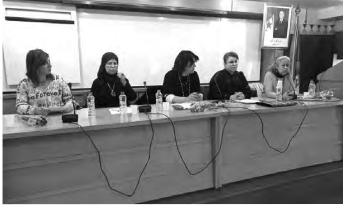
4. 3. 2. 1. اللقاء - ملتقى الندوة.