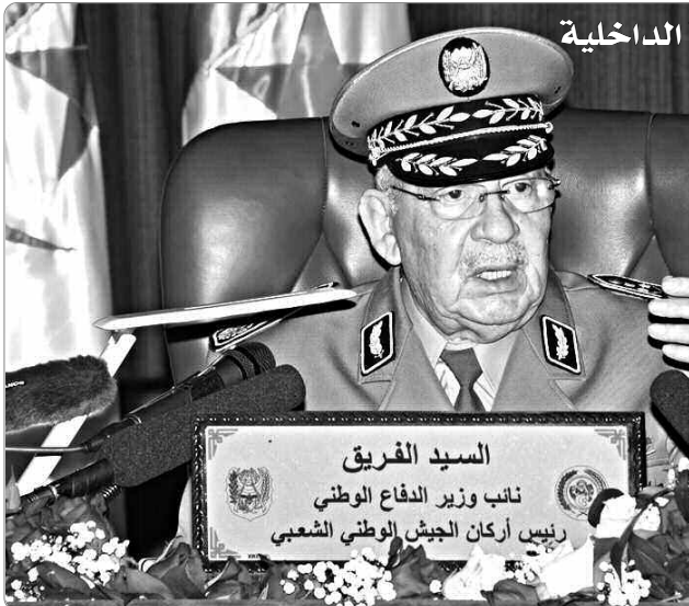
السيد الفريق نائب وزير الدفاع الوطني رئيس أركان الجيش الوطني الشعبي

أكد الفريق قايد صالح، نائب وزير الدفاع الوطني، رئيس أركان الجيش الوطني الشعبي، أمس، خيبة مسعى "العصابة وأذئابها لعرقله الخبيرين من الشعب والجيش، حيث "تأكدوا بأنفسهم بأنهم أخطأوا في حق شعبهم" عند مشاهدة الهبات الشعبية عبر كل ربوع الوطن، مشيراً إلى وجود أطراف لا تريد مطلقاً أن تبقى الجزائر محصنة وتفتح طريق الأمن والاستقرار والتنمية، و أنها "حاولت يائسة مراراً وتكراراً، من أجل تحقيق أهدافها الخسيسة، التأثير الماكر والخبث على صلابة الجبهة الداخلية وعلى قوة تماسك وتلاحم النسيج المجتمعي للشعب الجزائري".