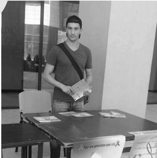
جانب من التشاير