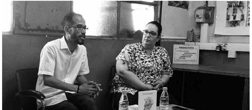
جانب من الندوة

هذه الكتب لا توجد في المكتبات الجزائرية مثل الكتاب الأخير لليلى صبار، أي أن القارئ الجزائري يمكن له أن يجد ضالته في هذا المقهى، في انتظار تعميم الفعالية في مقاهي أخرى بالعمامة ووهران وعناية ومدن أخرى.